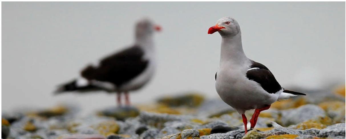
Dolphin gull (delfinmåsar).