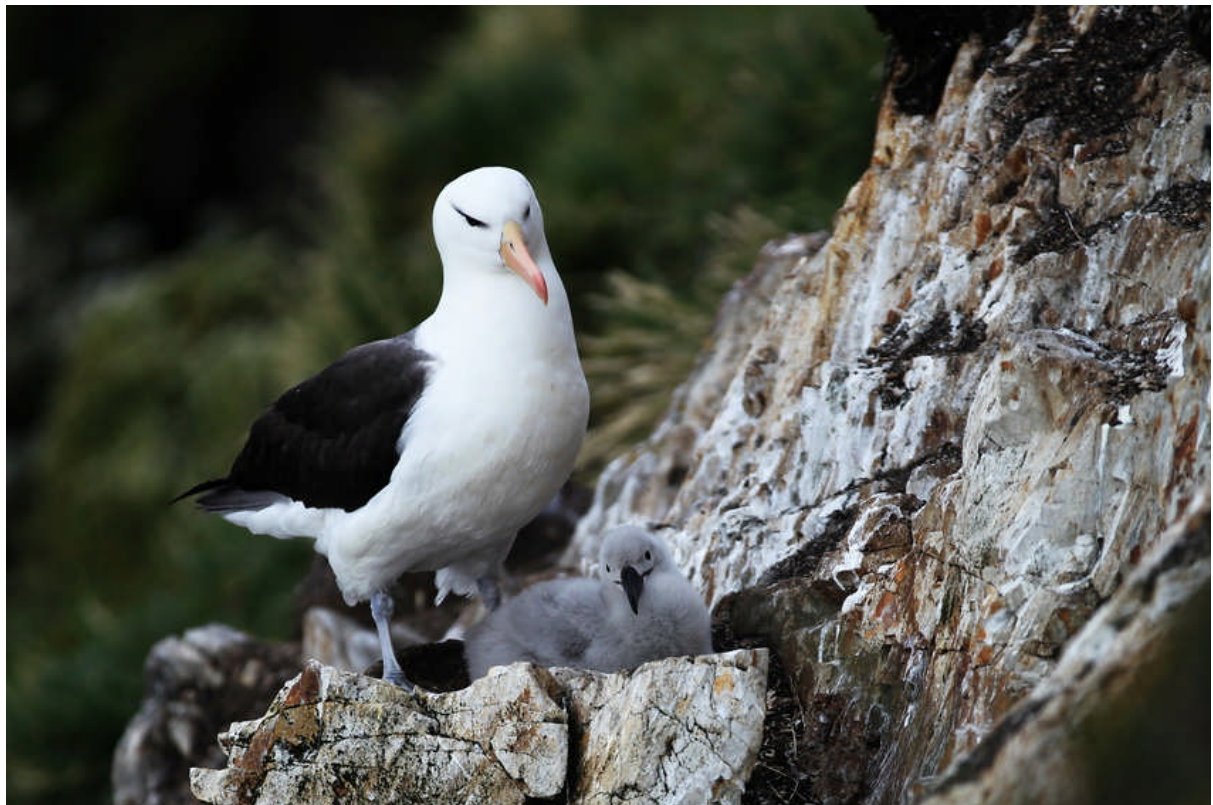
Svartbrynad albatross med unge.

Jag skall tillägga att där vi höll till var det helt säkert att vara, men om man ger sig ut på någon vidlyftighet för att få bättre bilder från nya vinklar, kan ju olyckan vara framme. Eftersom vi befann oss i utkanten av kolonin var det endast några få bon som låg så till så att de gick att fota. Som närmast var vi 10-15 meter från fåglarnas bon. På detta avstånd bryr sig fåglarna överhuvudtaget inte om oss, så vi kunde i lugn och ro fota så mycket vi ville.