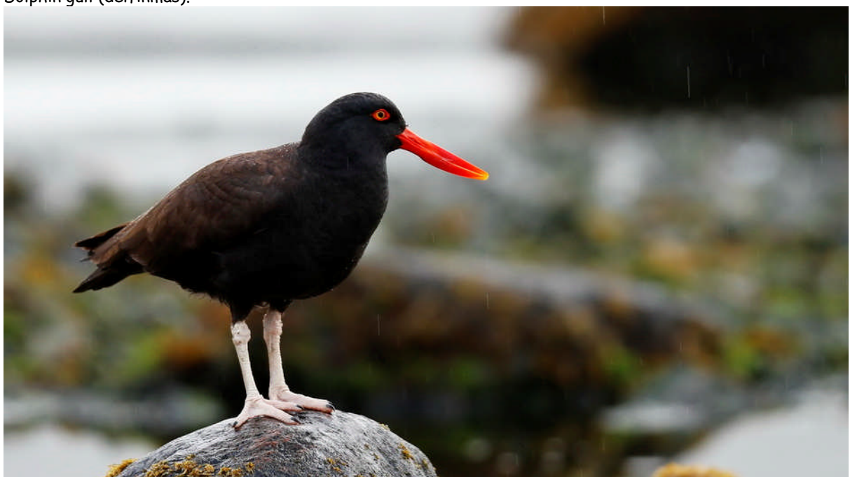
Svart strandskata. En släkting till vår egen strandskata.