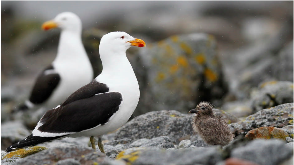
Kelp gull (tångtrut) med unge. Troligen en nära släkting till vår havstrut.

Några av de fåglar som fastnade i kameran denna morgon.