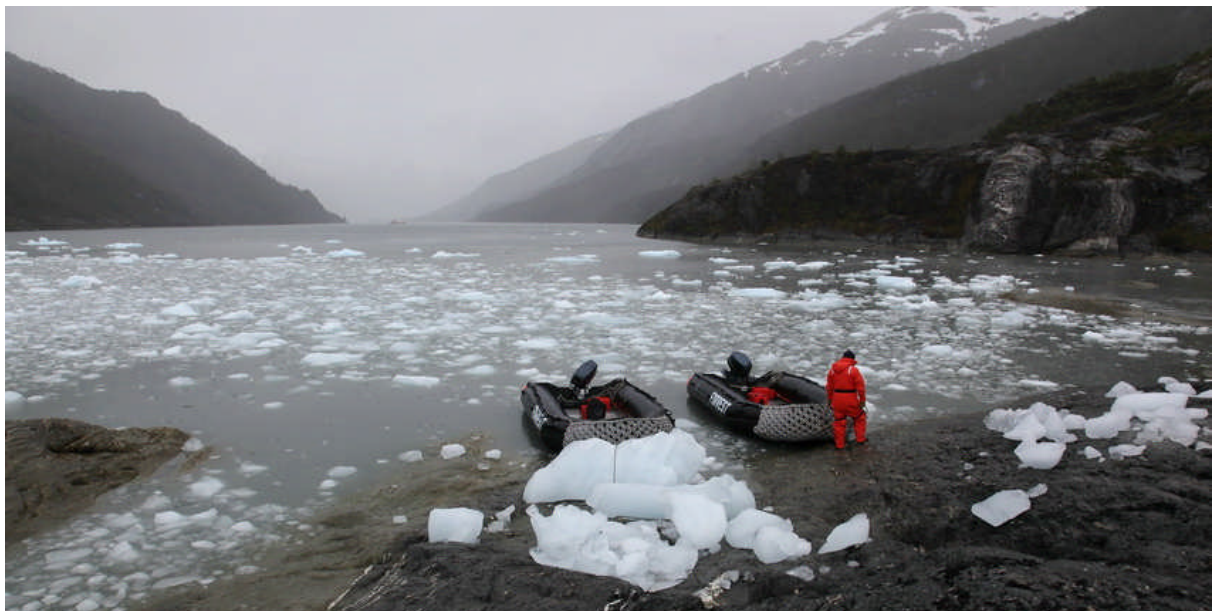
Längst ut i horisonten ligger Forrest och väntar. Båten får inte gå in hit då fjorden ännu inte är kartlagd.