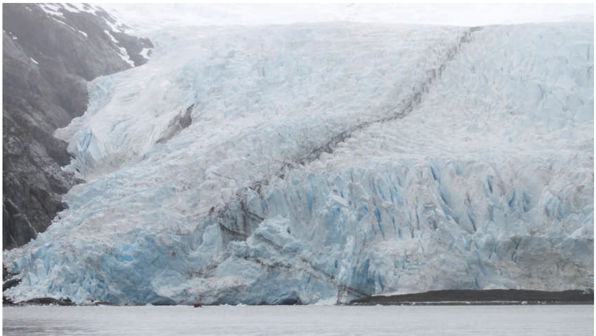
Längst in i fjorden ligger glaciären Serrano. Vi landsteg på den lilla landtungan längst ner i vänstra hörnet av bilden.