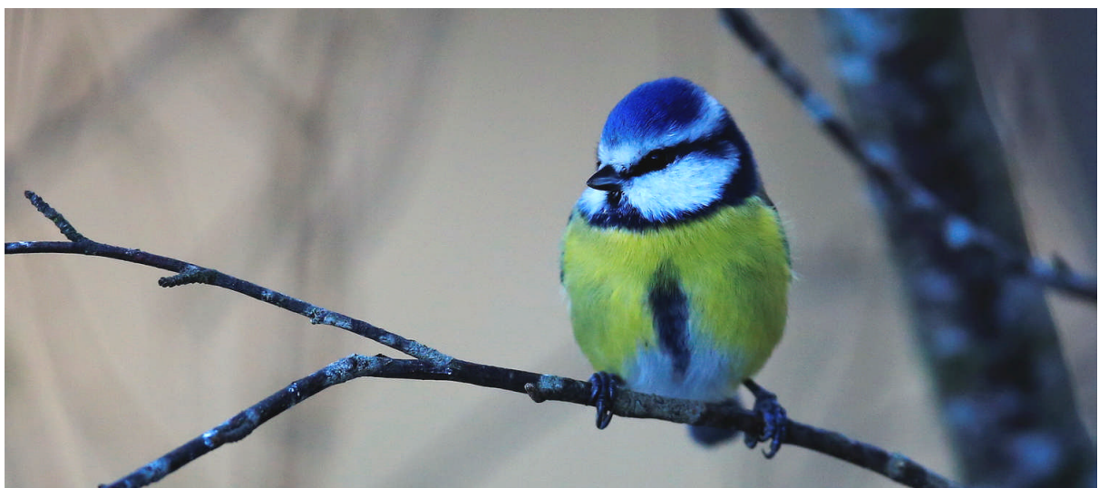
Blåmesen är här varje dag.