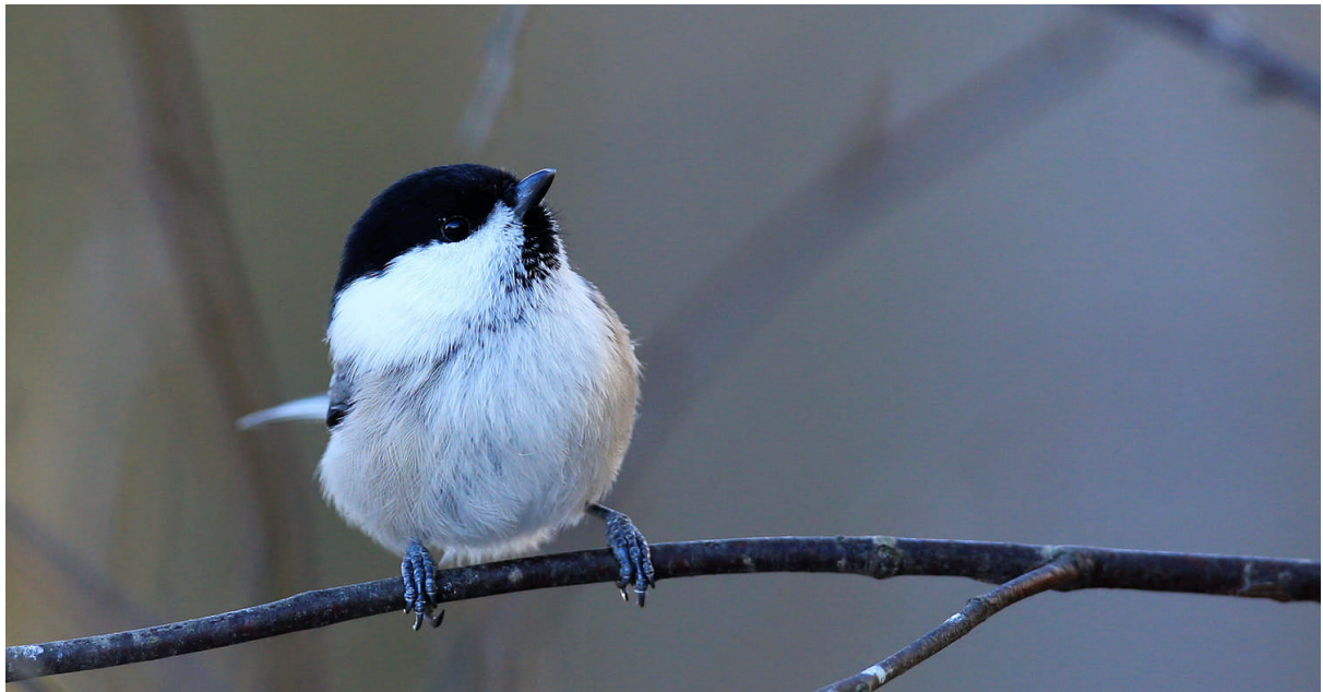
Talltitan är också en säker gäst. Det händer att den också kommer och tar frön i min hand.