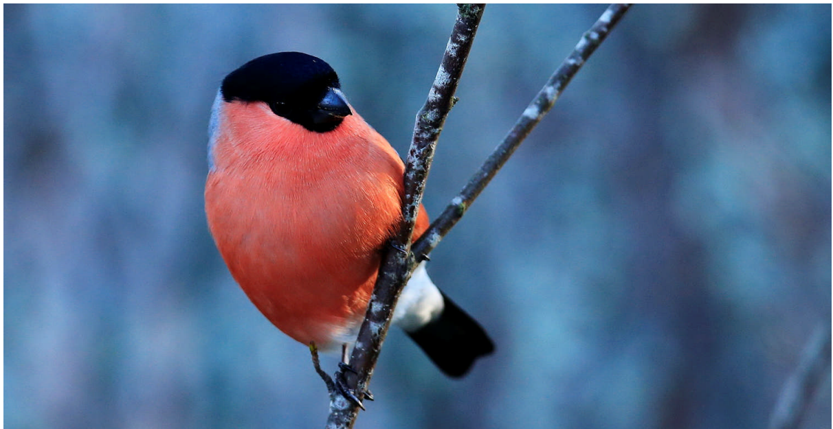
Domherrarna är alltid stadiga gäster. Även om de inte alltid finns vid fågelmatningen vet jag att de nästan alltid finns alldeles i närheten och de är lätta att locka på. Då brukar de komma efter en stund.