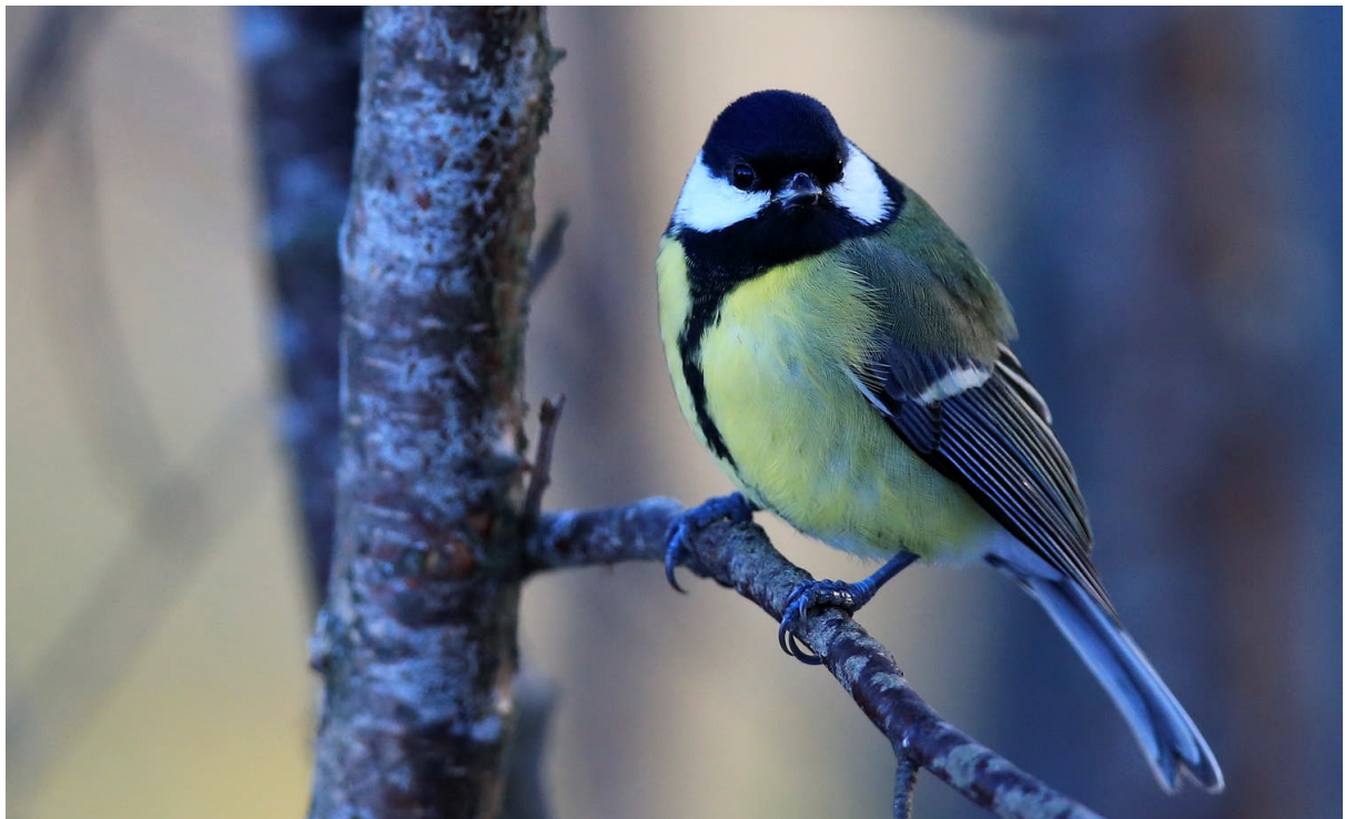
Talgöxe. Svårflirtad, har aldrig hämtat ett enda frö ur min hand.