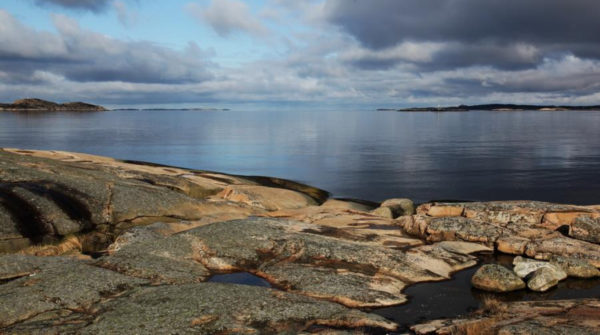
Capri . Bild nr. 2012-04-21_2262_(169).jpg 5554 x 3124 pxl