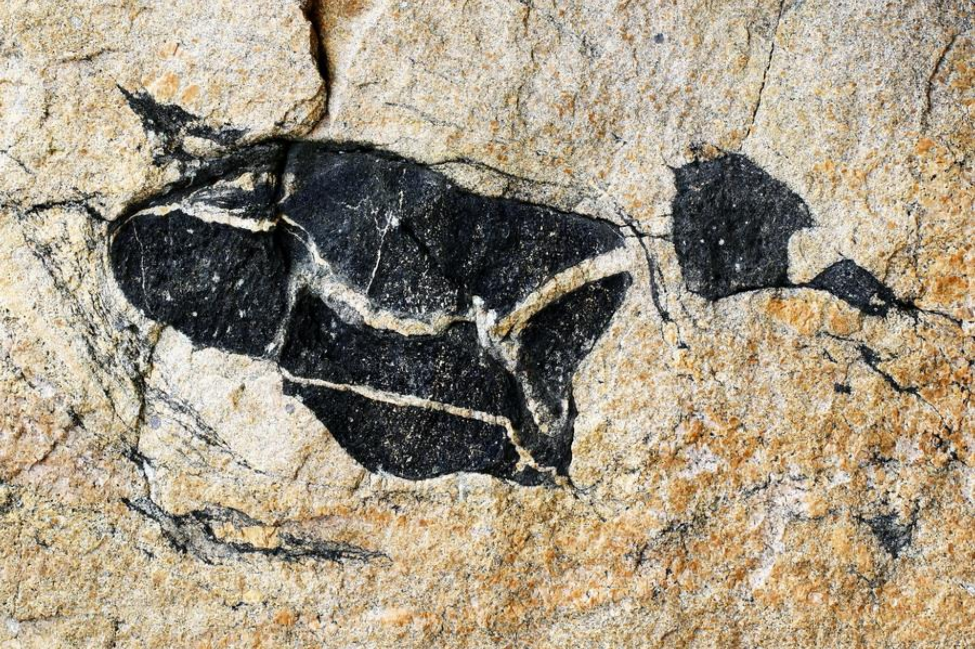
Figur i berg_2 Bild nr. 2013-09-01_061_(32)2.jpg 4198 x 2798 pxl För köpare av bilden medföljer förklaringen till vad detta faktiskt är.