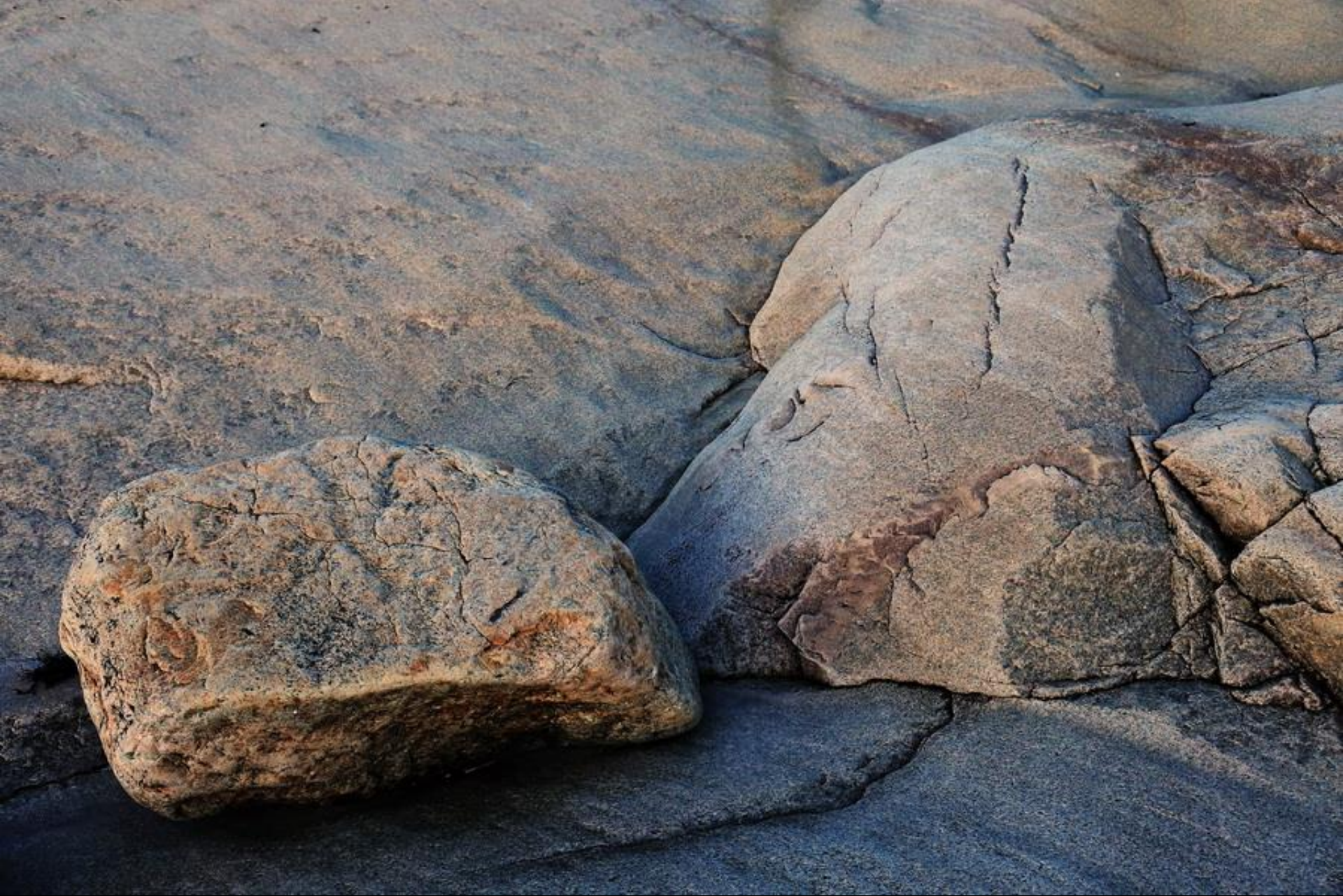
Snabeln i kläm. Bild nr. 2013-04-27 20-24-04_13_(32)2.JPG 5184 x 3456 pxl Finns inom Capri's område.