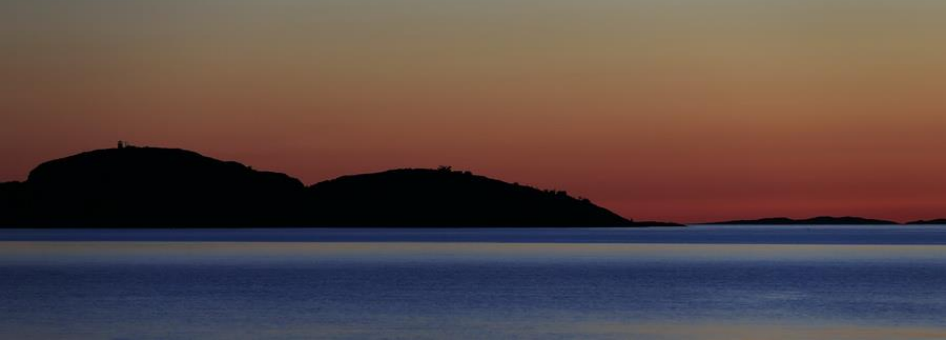
Capri . Bild nr. 2013-08-25_063_(xxx).jpg 5114 x 1854 pxl