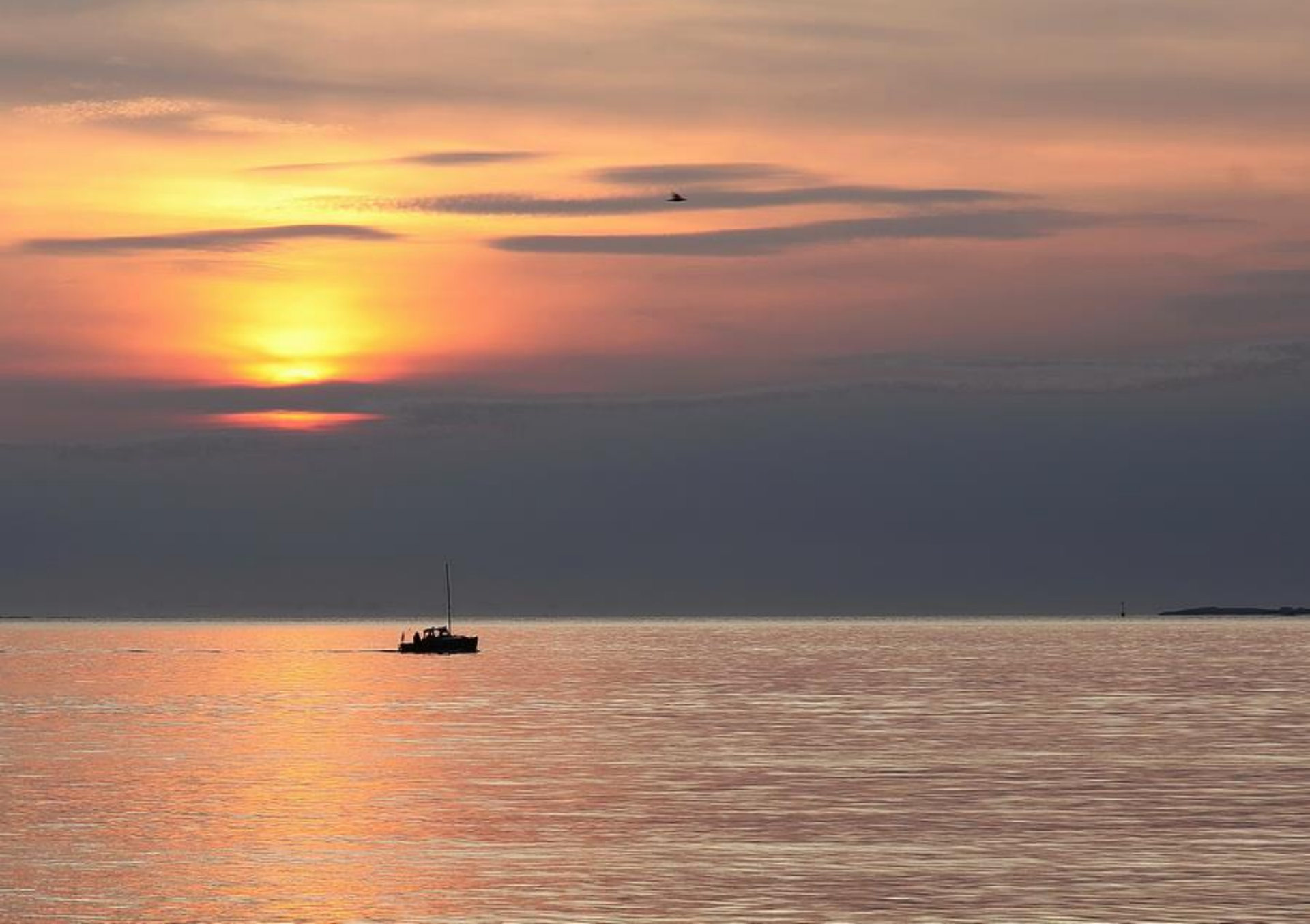
Capri. Bild nr. 2009-08-24_4294A2.jpg 2956 x 2091 pxl