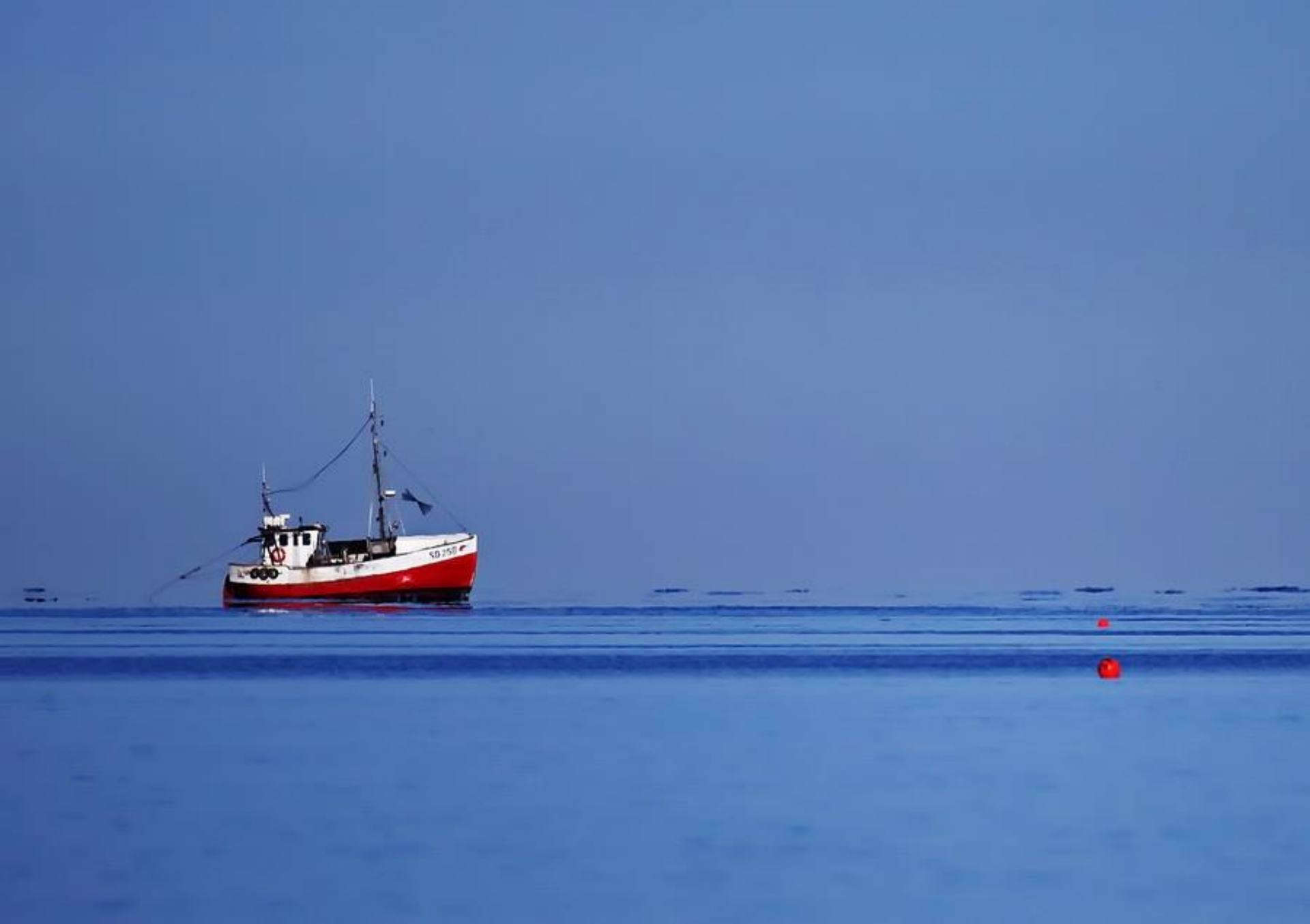
Capri. Räktrålare SD258. Bild nr. 2010-05-03_1450A2.jpg 2692 x 1904 pxl