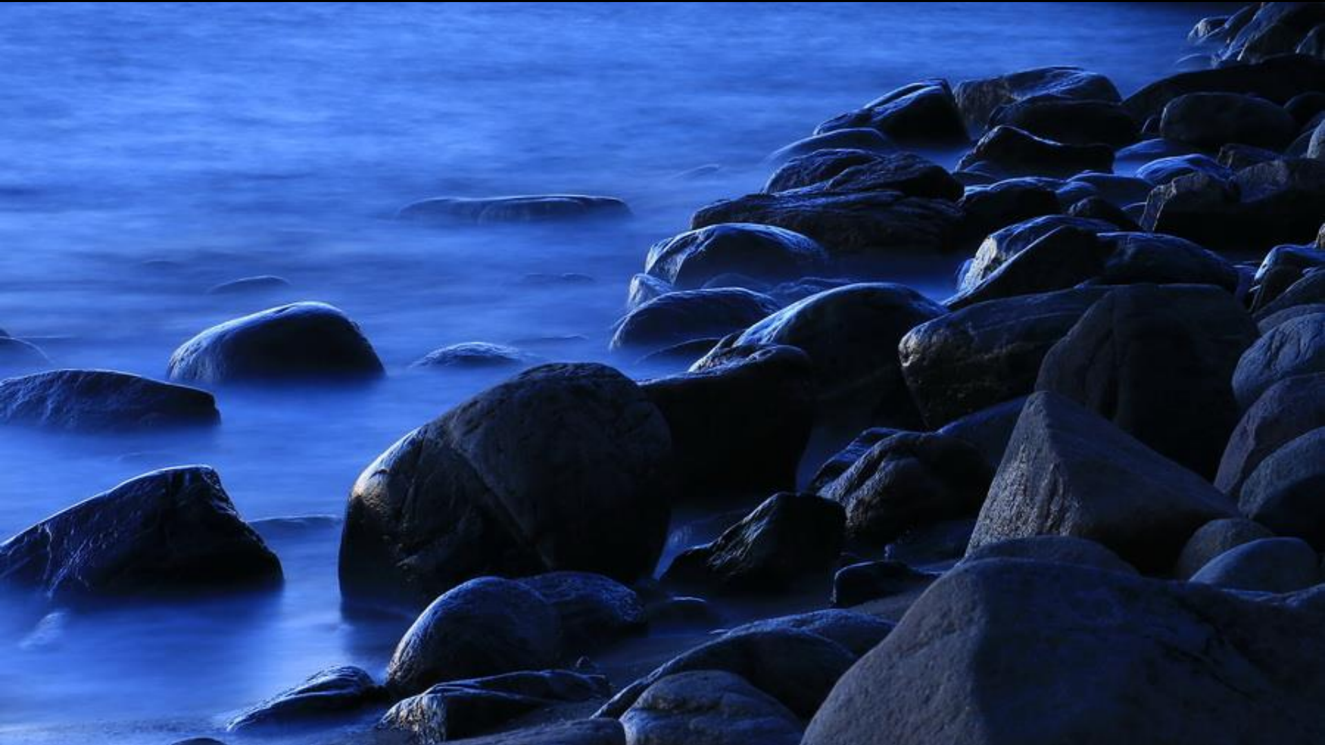
Capri . Bild nr. 2013-04-30_52_(169).jpg 4128 x 2322 pxl