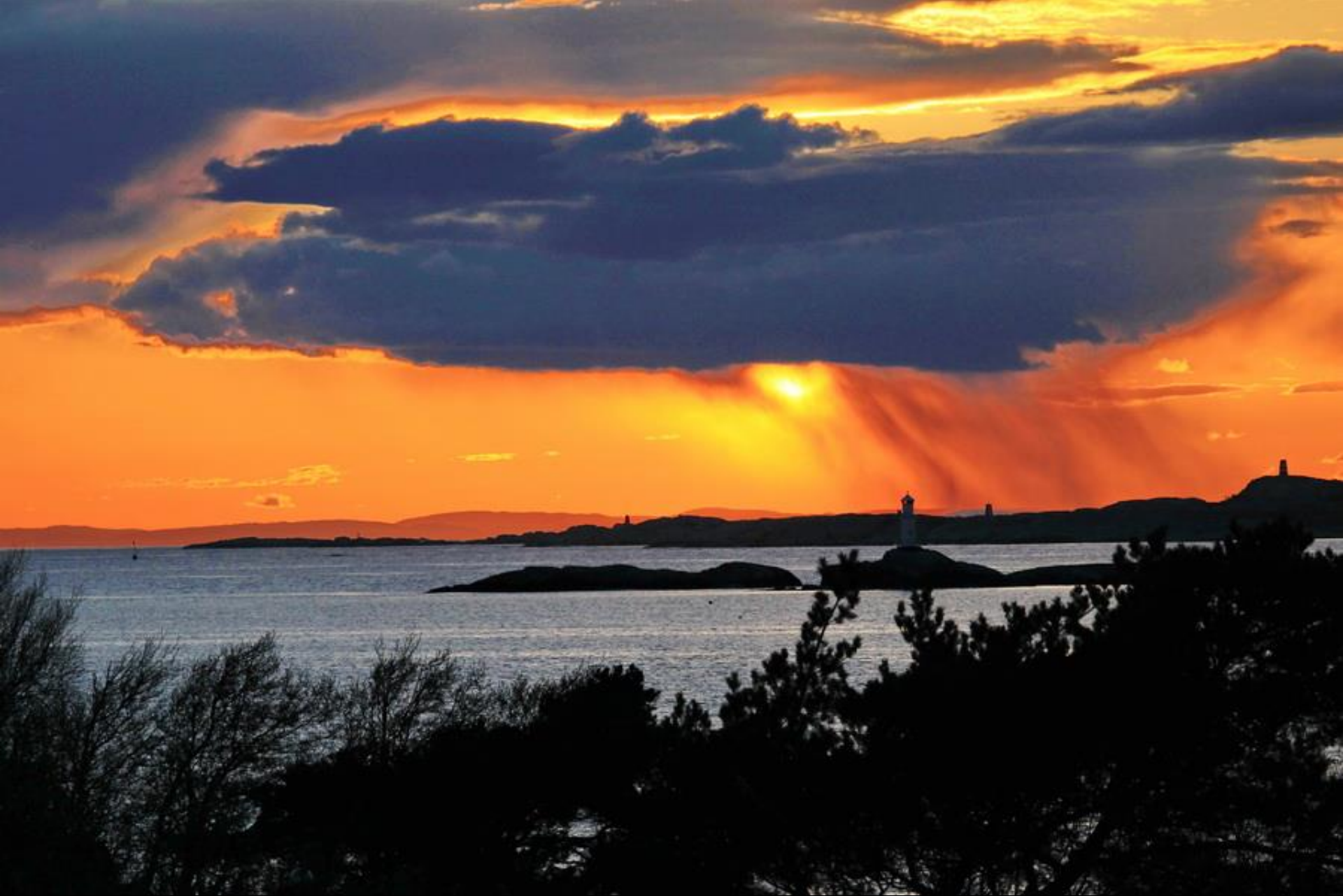
Capri. Bild nr. 5D_IMG_1053_(32).JPG 5221 x 3481 pxl