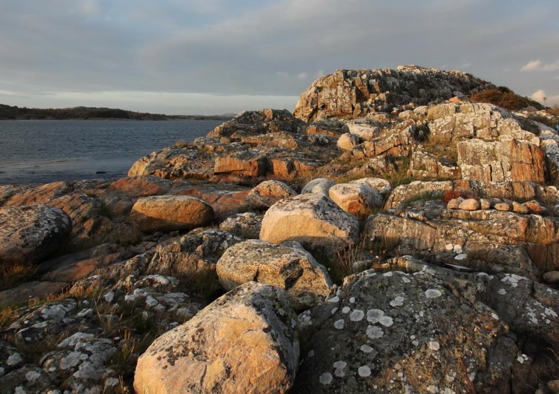
Strömstads skärgård. Bild nr. 2009-09-12_5267A.jpg 4518 x 3192 pxl Kvällsfoto.