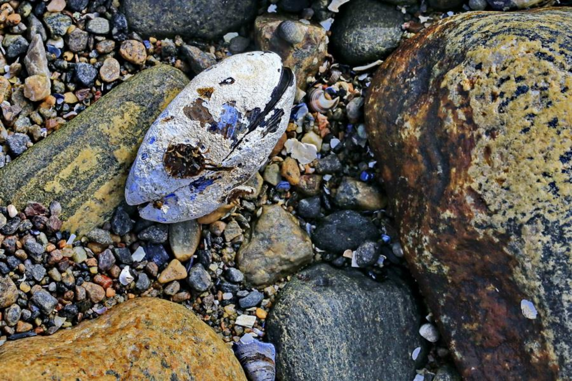
Snäckskal av blåmussla. Bild nr. 2013-08-25 11-48-46 1DX032_(32)2.jpg