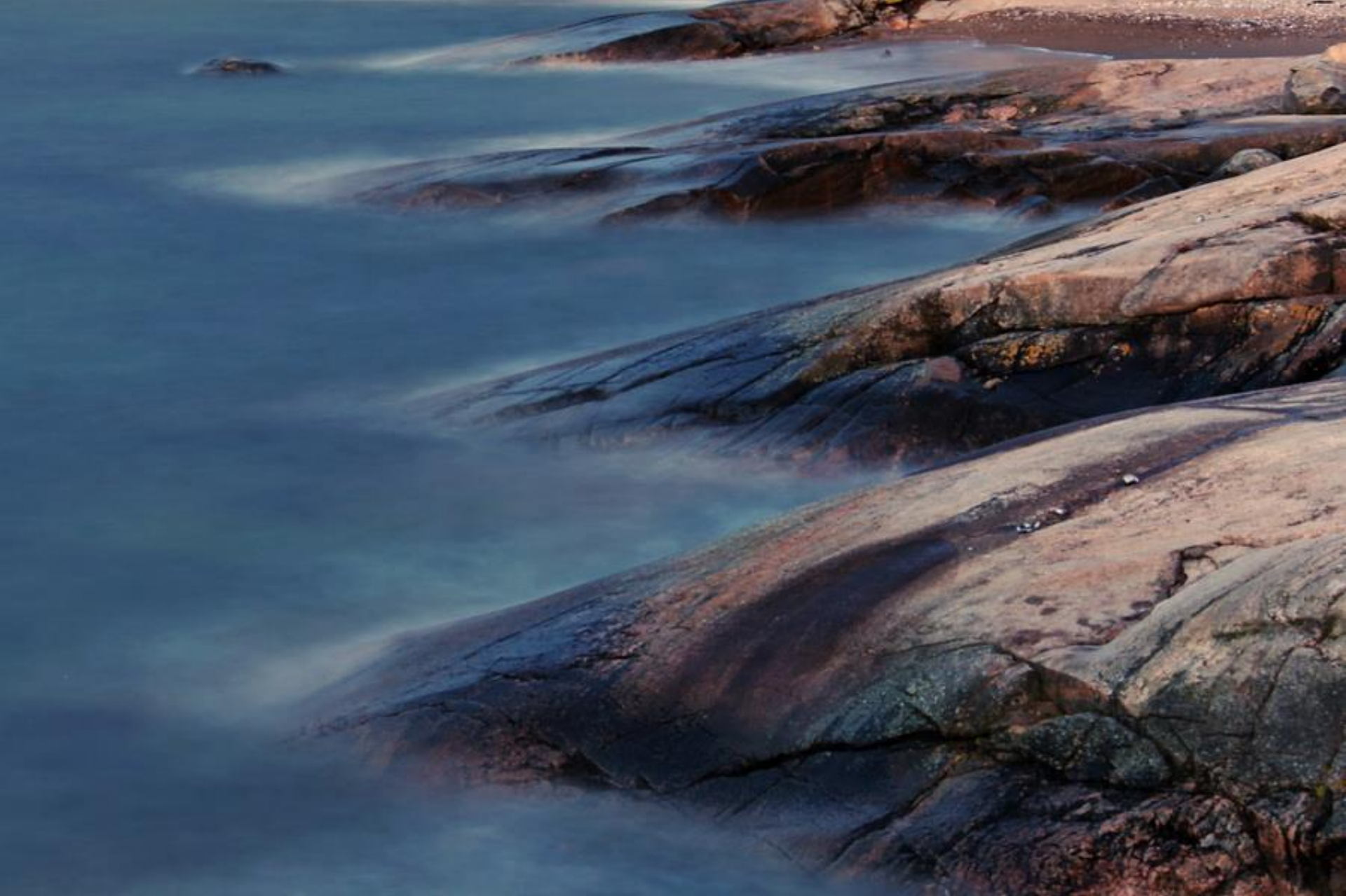
Capri . Bild nr. 5D_IMG_1614_(32).JPG 4685 x 3123 pxl Fotad vid Capri strand.