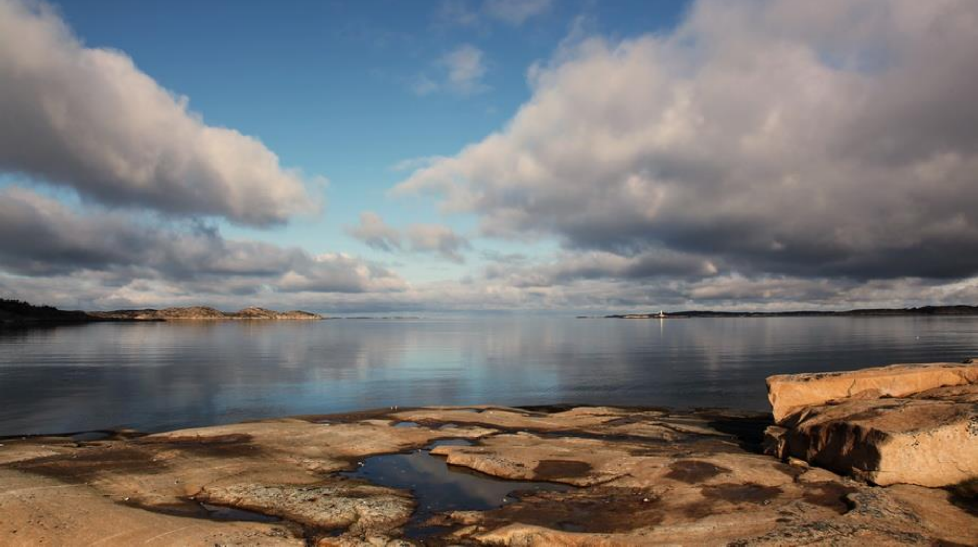
Capri . Bild nr. 2012-04-21_2259_(169).jpg 5616 x 3159 pxl