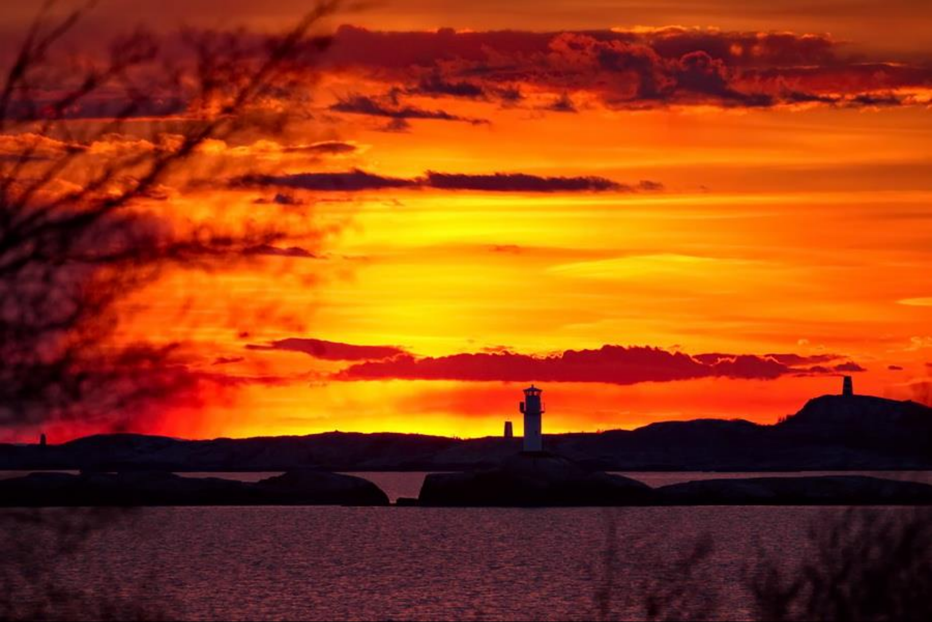
Capri. Bild nr. 2016-04-27 20-01-56 - 0106_(32).JPG 3868 x 2578 pxl