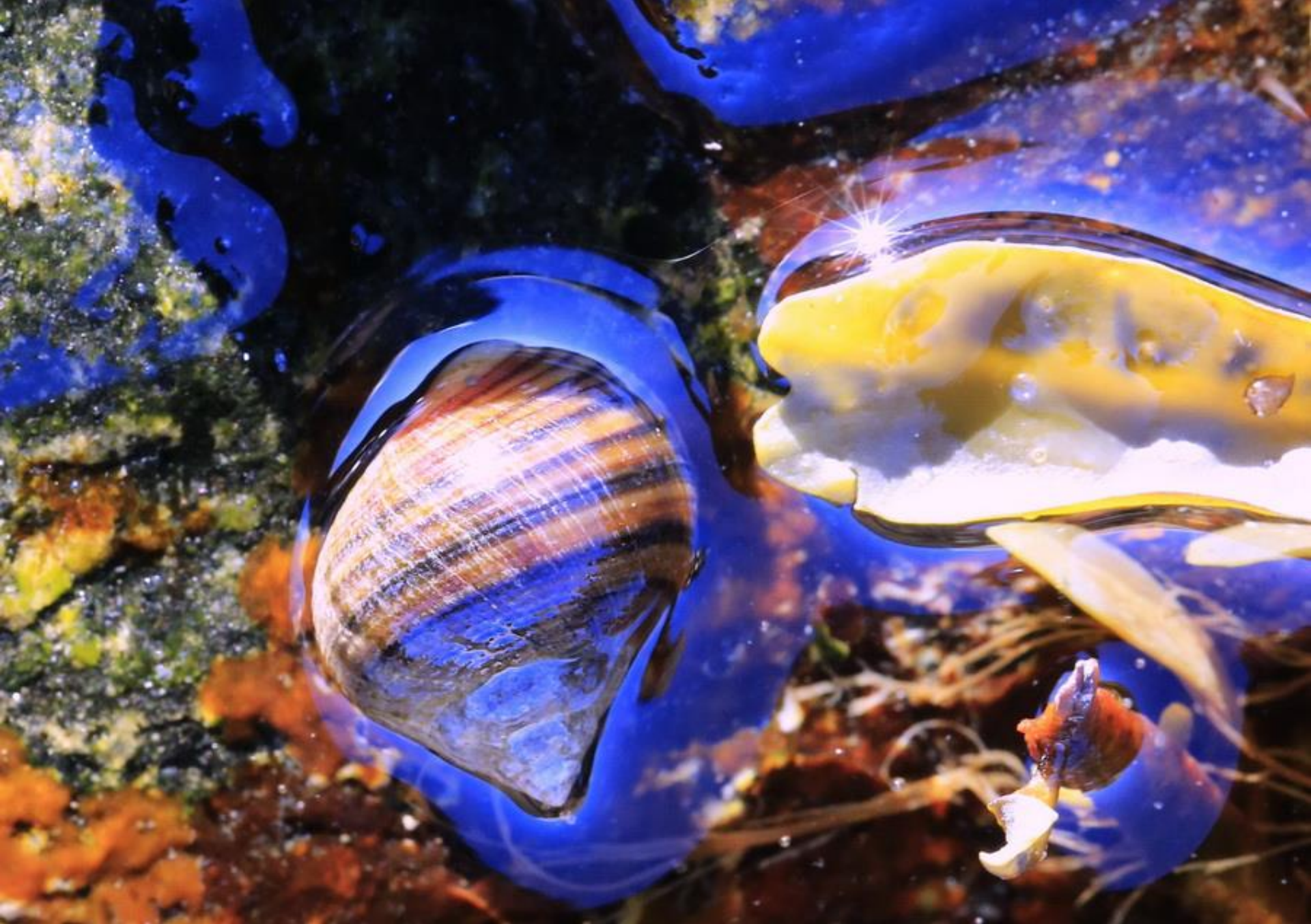
Vattenkonst 2. Bild nr. 2013-08-25_015A.jpg 2551 x 1804 pxl. Fotad vid Capri's strand. Macrofoto.