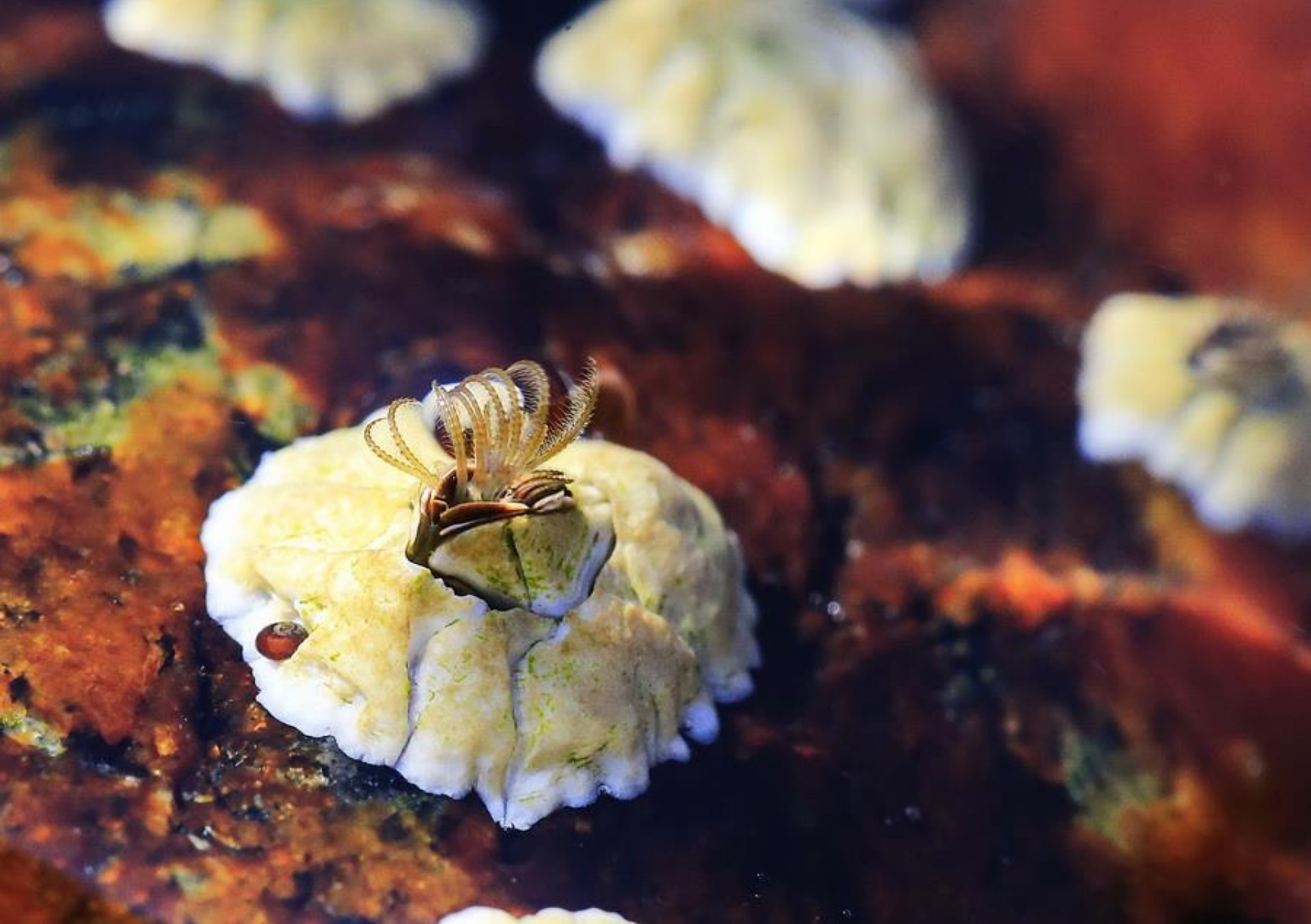
Capri . Havstulpan. Bild nr. 2013-08-25_094A.jpg 2414 x 1707 pxl. Fotad vid Capri's strand. Macrofoto.