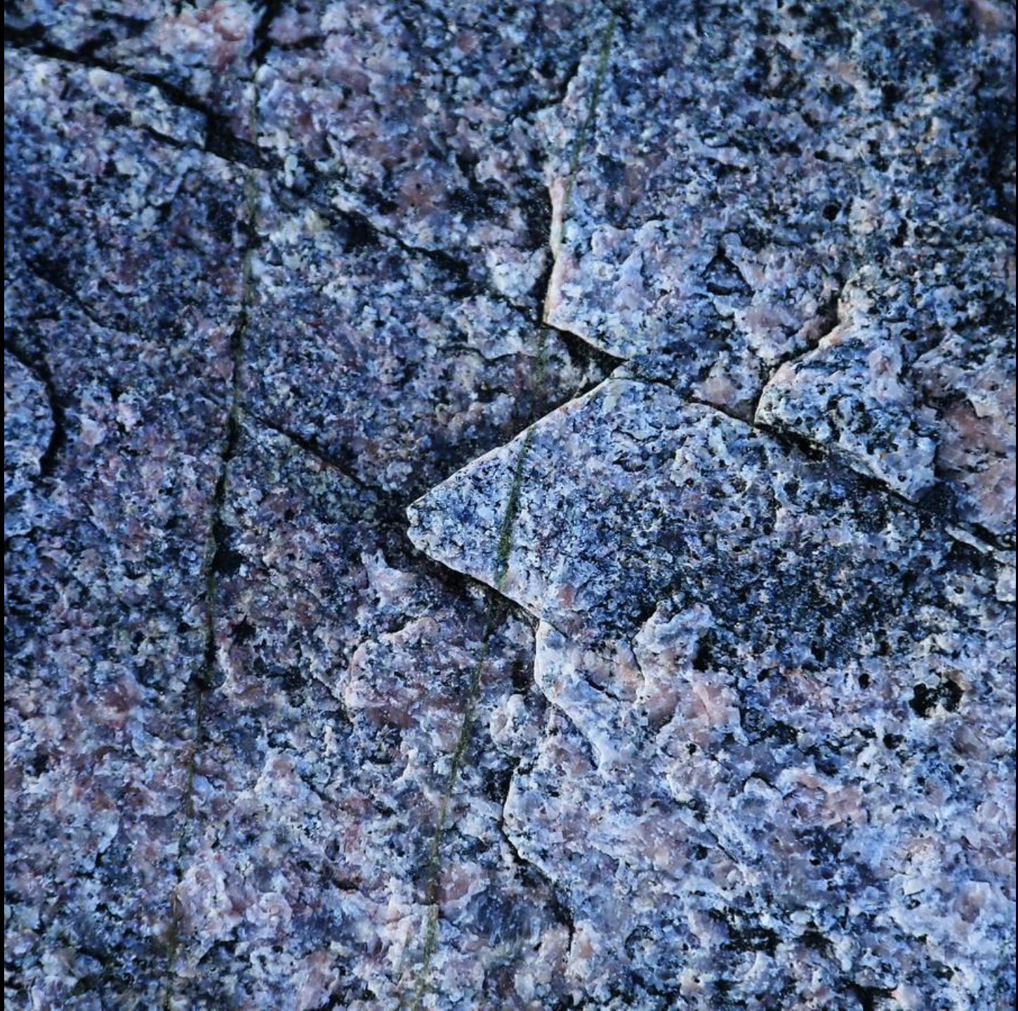
Figur i berg 1