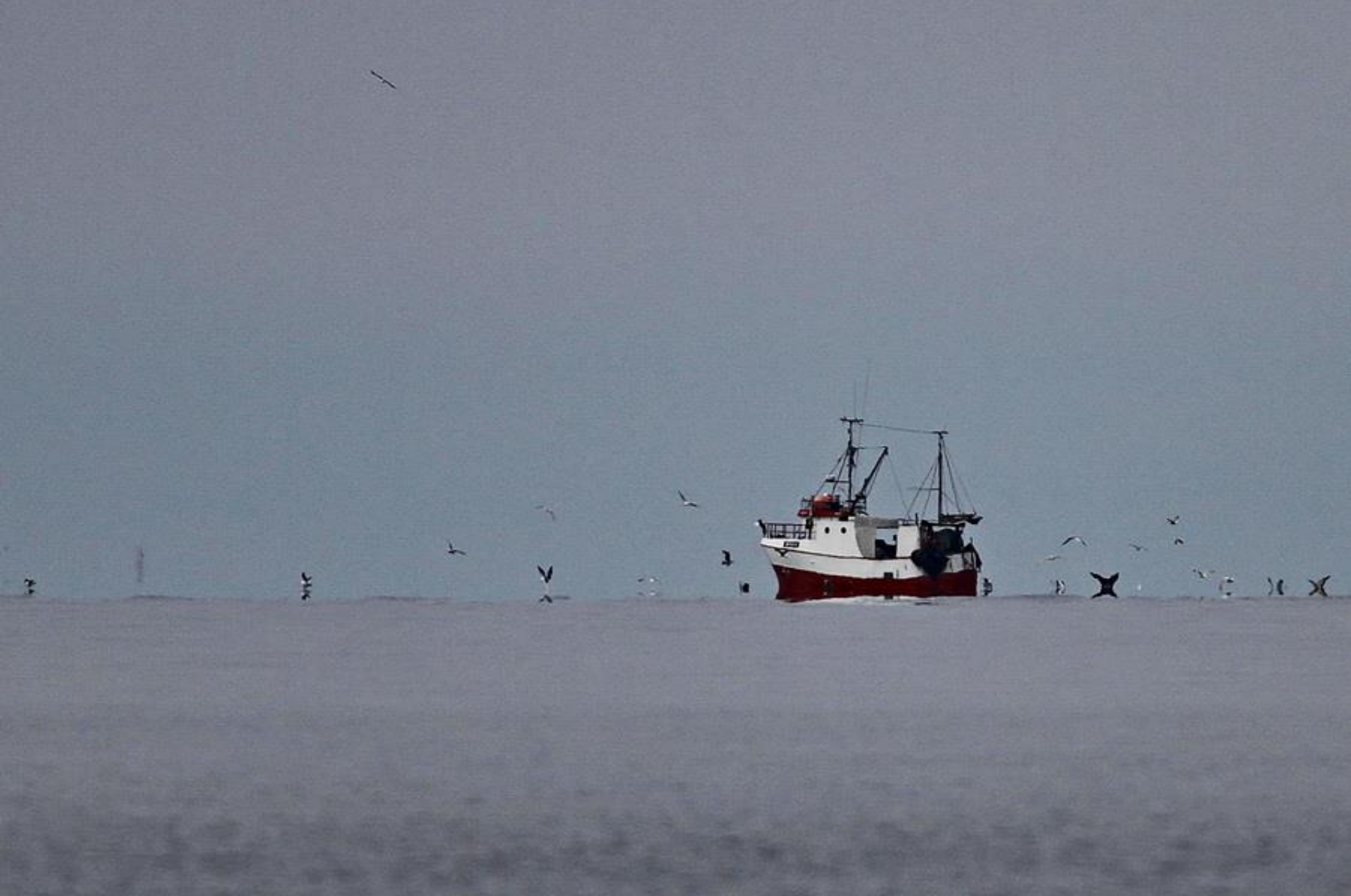
Capri. Bild nr. 2012-04-23_4046_(32).jpg 2532 x 1688 pxl