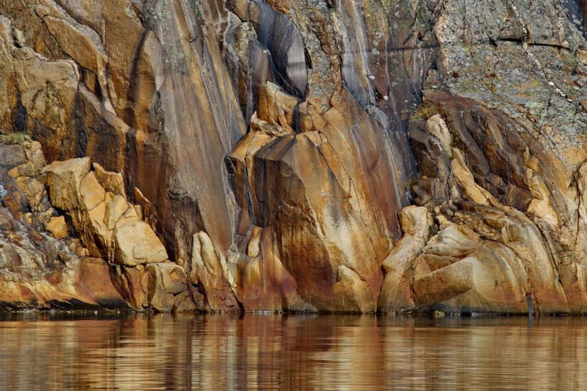
Bergvägg i Dynekilen . Bild nr. 2016-09-05 10-35-24 - 0099_(32)).jpg 1920 x 1280 pxl