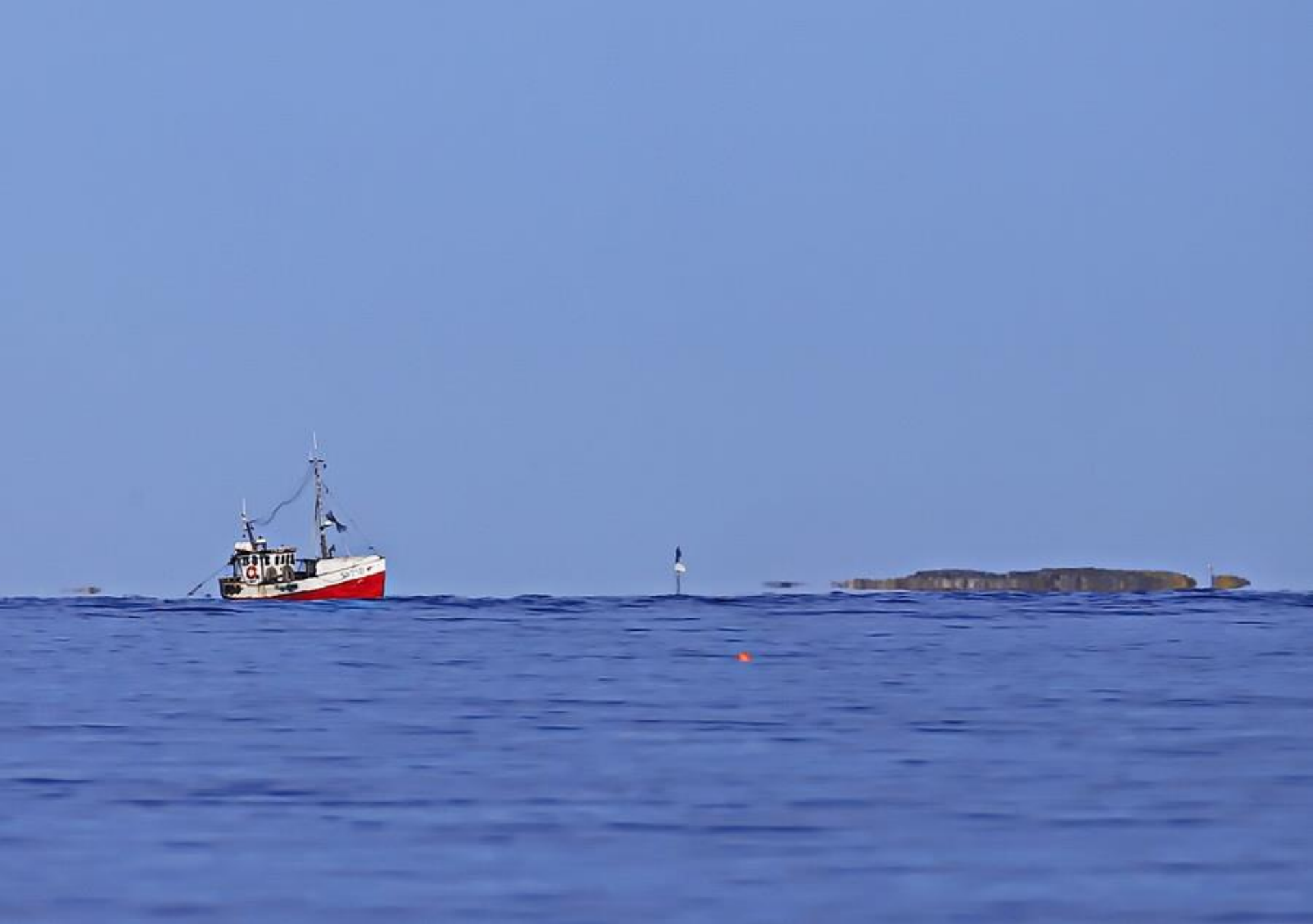
Capri. Räktrålare SD258. Bild nr. 2013-05-01_40A.jpg 2457 x 1738 pxl