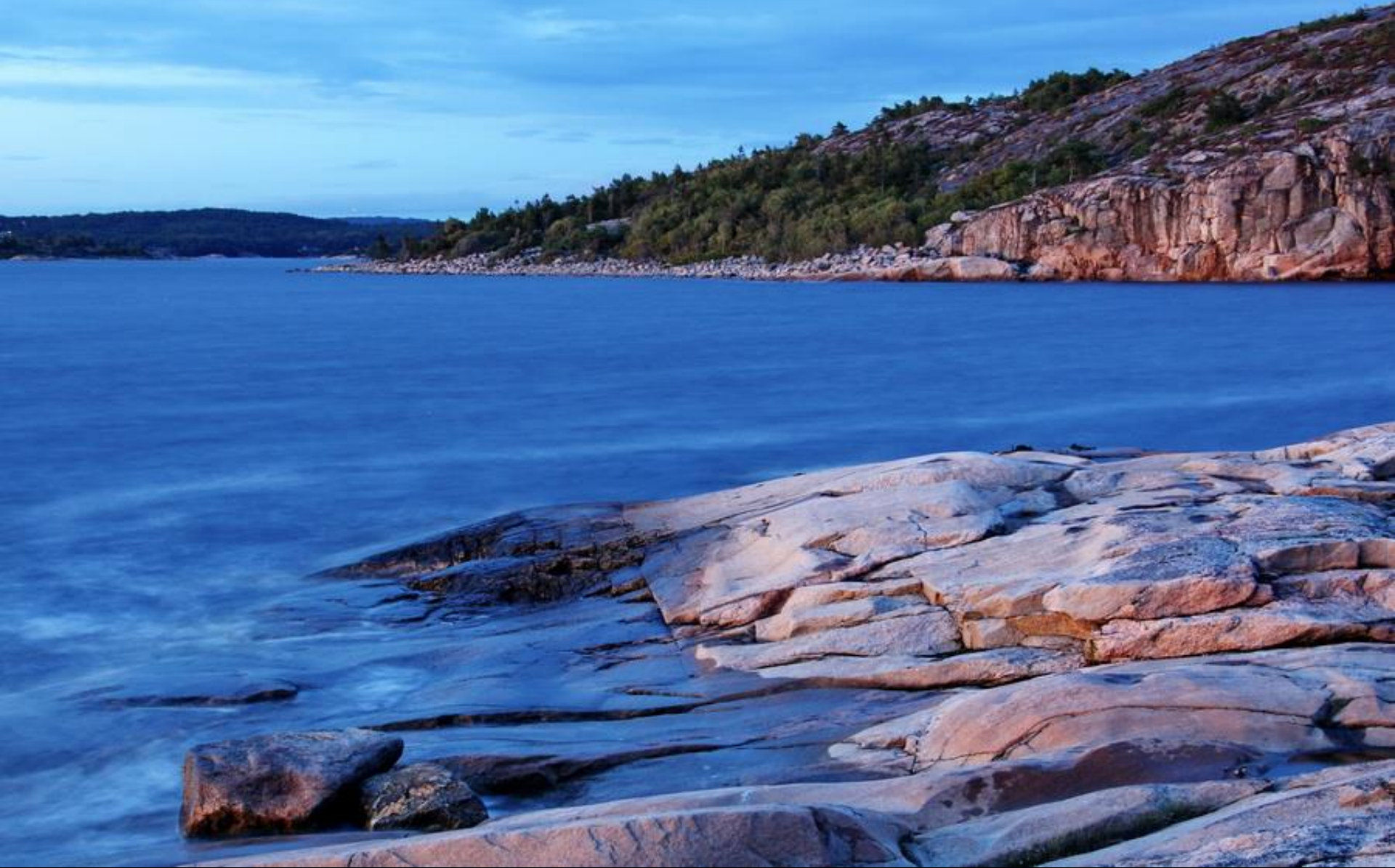
Capri . Bild nr. 2011-09-07_3763_(58)2.jpg 5236 x 3272 pxl