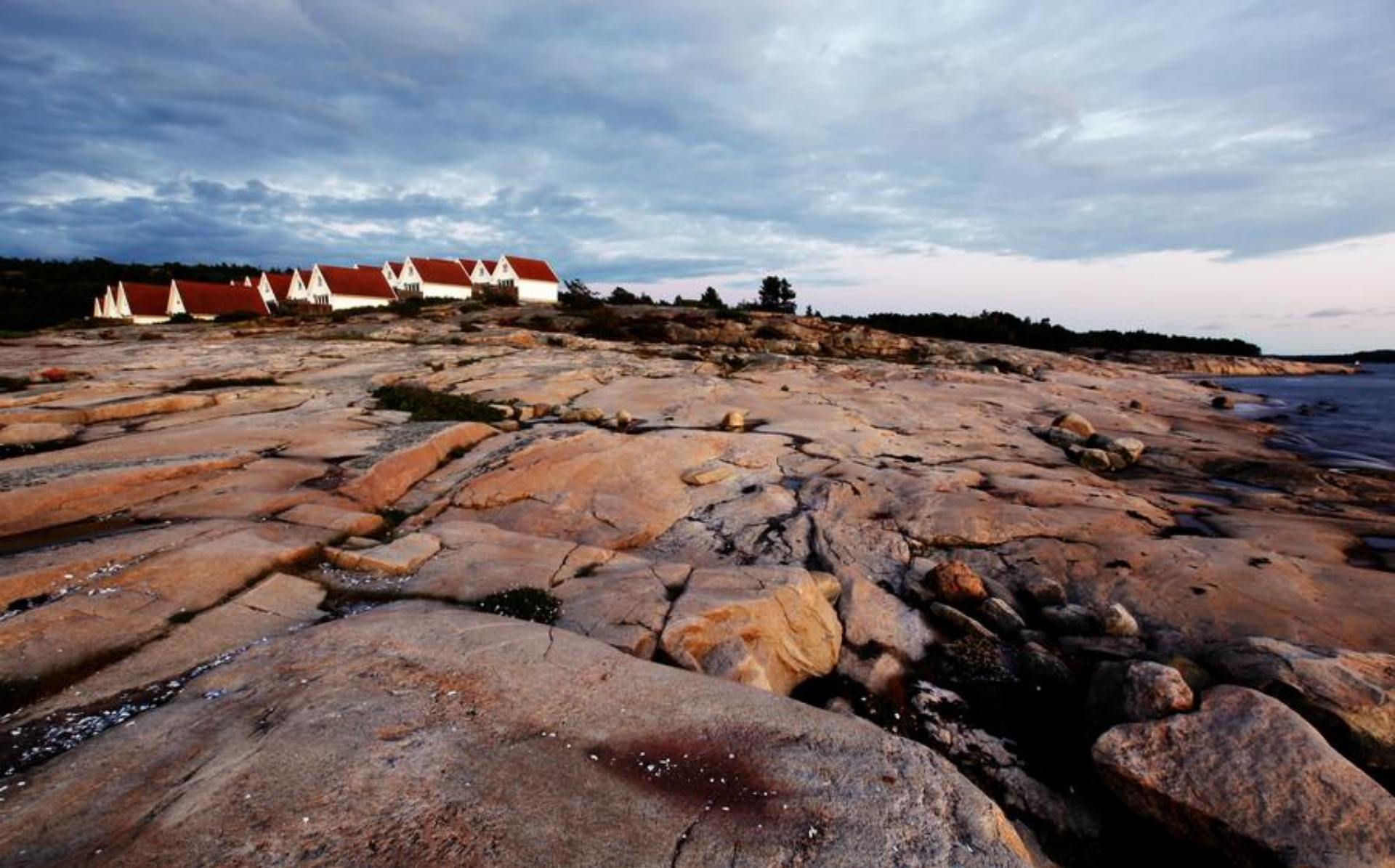
Capri . Bild nr. 2011-09-01_3431w2.jpg 5592 x 3495 pxl