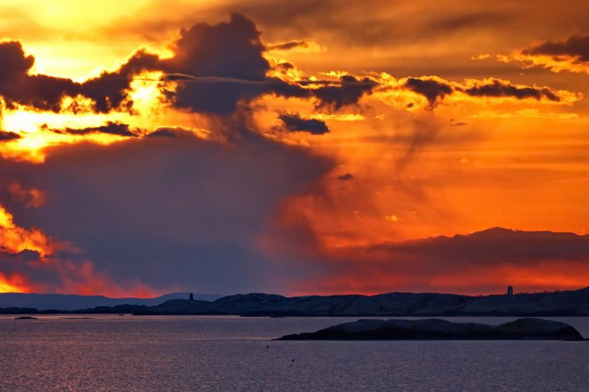
Capri . Bild nr. 2016-04-27 19-49-34 - 0071_(32).JPG 2678 x 1785 pxl